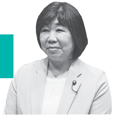
高橋 恵美子 議員