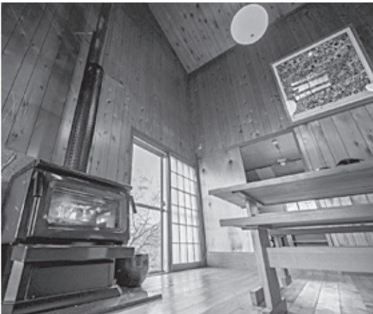
三井野原 一棟貸し農泊施設